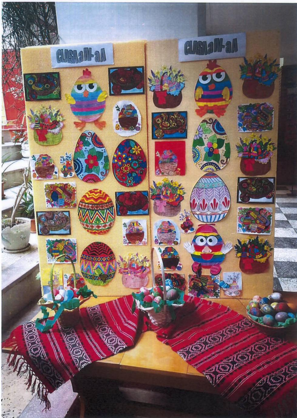
Din lucrările cu temă pascală ale copiilor din clasa a IV-a A.